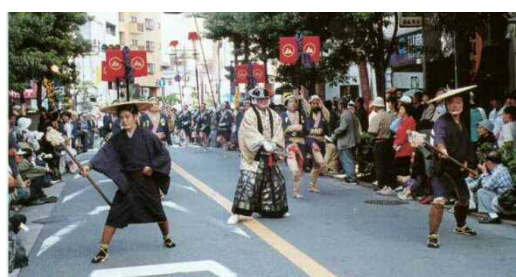
大川崎宿祭り大名行列

慶長 6 (1601) 年に徳川家康によって東海道に宿駅・伝馬制度ができてから 400 年後の平成 13 (2001) 年、「東海道宿駅制定 400 年記念大川崎宿祭り」が地域の方々に結成された「大川崎宿祭り実行委員会」の主催により開催され、川崎宿で有名な茶屋であった万年屋の再現、「六郷の渡し」の復活、川崎ゆかりの歴史時代行列をはじめとした大パレードなどを行い、参加者は延べ 3,000 人を超え、10 万人の人出で賑わった。これを契機に、川崎宿を軸とした歴史・文化を活かしたまちづくりの機運が高まることとなる。