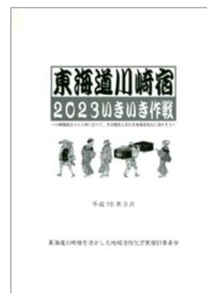
東海道川崎宿 2023 いきいき大作戦

「大川崎宿祭り」の翌年の平成 14 (2002) 年、川崎宿の歴史を後世に伝えていくため、町内会・まちづくりクラブ・観光ボランティアガイドなどが集まり、「東海道川崎宿を活かした地域活性化方策検討委員会」が結成された。そして、平成 15 (2003) 年、川崎宿起立 400 周年にあたる 2023 年を活動の目標年次に定めた、川崎宿を活かした地域活性化のための市民提案書の「東海道川崎宿 2023 いきいき大作戦」をまとめ、川崎宿の歴史・文化に触れられ、地域交流などができる拠点整備の必要性もうたわれた。