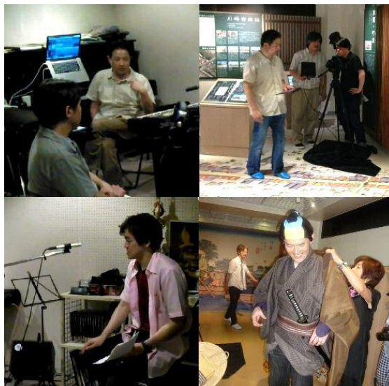
音楽・音響制作、ナレーション録り 現場ロケ等の様子