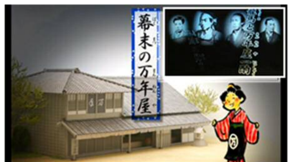
2階ものがたりBOX「幕末の万年屋」