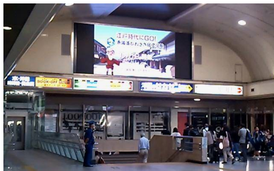
アゼリアビジョン映像

映像コンテンツとしては、JR川崎駅東西自由通路のアゼリアビジョンや区役所の情報掲示用液晶パネルなどで繰り返し放映する30秒のコーシャル映像と、YoutubeにUPしたり、配布用DVDに掲載したりする6分ほどの施設紹介映像