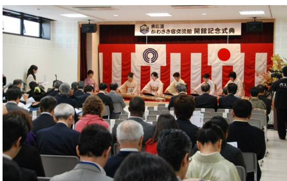
開館式典 箏の演奏