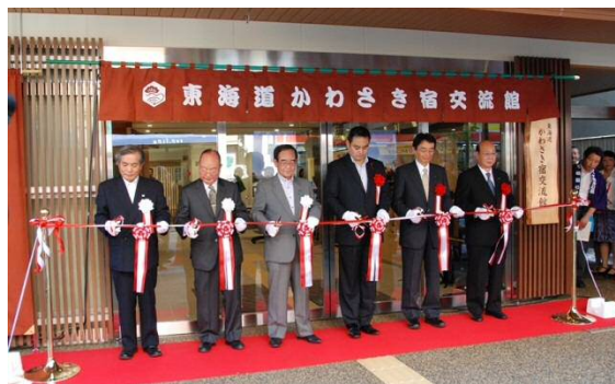
開館式典 テープカット

また、9 月 29 日に市民向け内覧会を行い、予想を大幅に超える約 650 名の方に来館いただき、そして 10 月 1 日に無事開館となった。