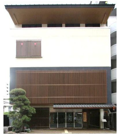
東海道かわさき宿交流館の外観

平成 23 年度には基本計画に基づき、具体の施設設計が進められ、建物は鉄骨造の 4 階建て、縦格子や軒など江戸時代の町屋のデザイン要素を取り入れた外観とした。また、主に 1 階から 3 階までが展示室、4 階は集会室とし、平成 24 年度には施設の建設が開始され、並行して具体の展示内容の検討、制作を進めた。