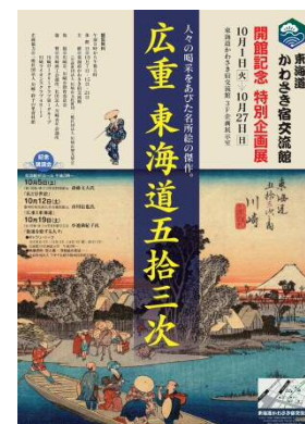
開館記念特別展ポスター