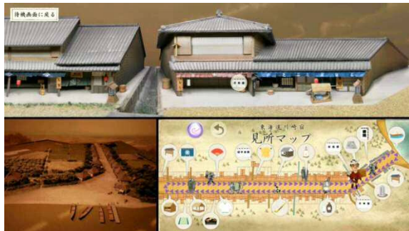
2階ものがたりBOX「再現・川崎宿の街並み」

3階は、江戸時代から現代に至る川崎の歴史や文化を様々な角度から展示したフロアで、コンパクトに分かりやすく見せる工夫をした。その1つに、大型ディスプレイを使った「川崎発掘・いまむかし」という装置があり、現在の市内の見どころ施設情報とともに、川崎の移り変わりを見てもらえる仕掛けとなっている。移り変わりは、タッチパネル式の大画面の中に明治から現代までの川崎市全域の空中写真と地図を重ね、画面をタッチすると、丸い覗き穴が開き、タッチするごとに次々と過去の時代に遡っていくことができる仕組みとした。また、1人だけでなく、複数の人が同時に操作しても対応するシステム（アルゴリズム）を工夫した。