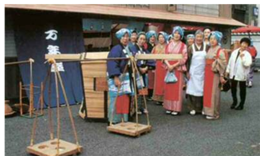
大川崎宿祭り万年屋を再現