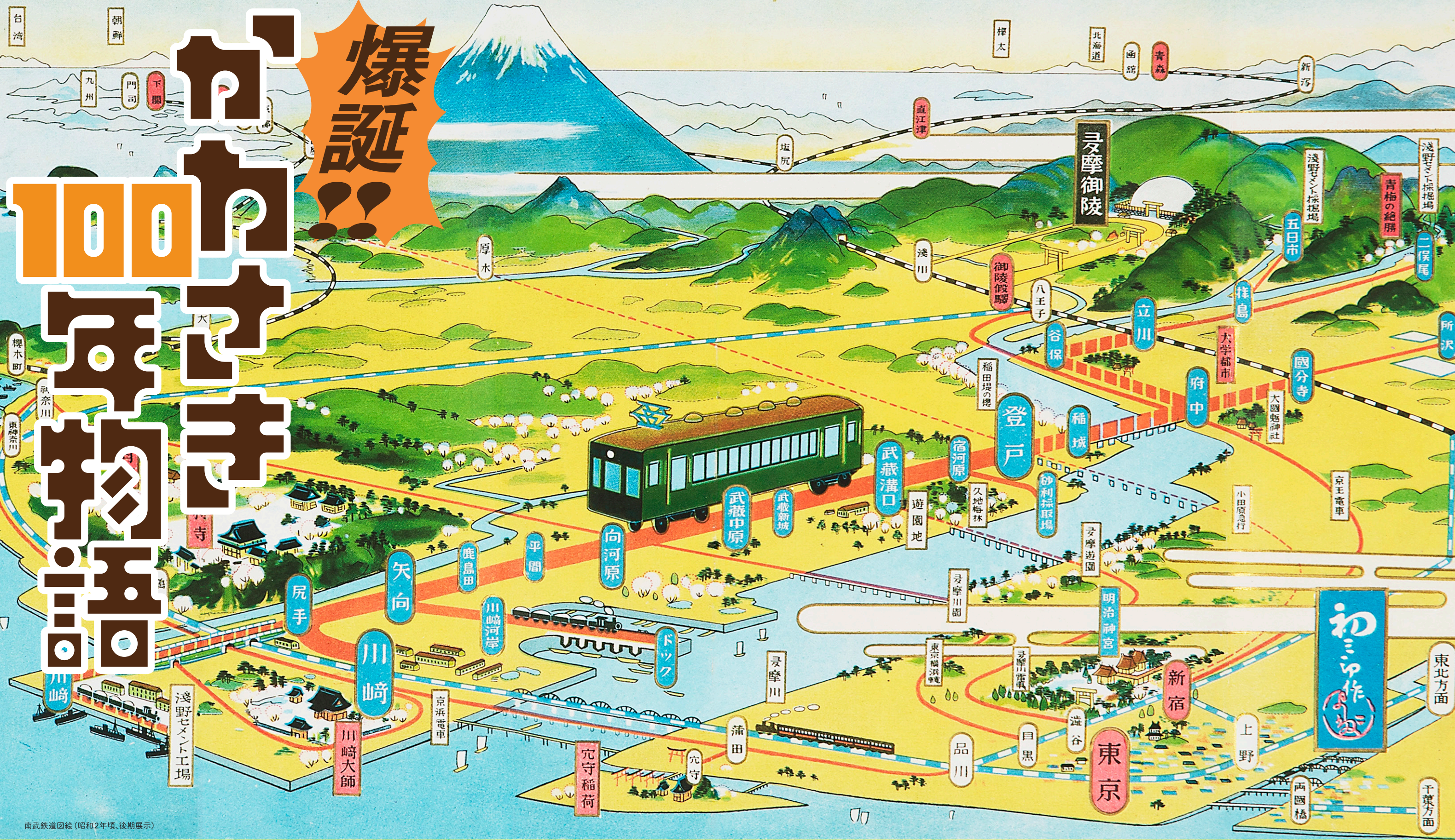
南武鉄道図絵(昭和2年頃、後期展示)

[前期] 2024 10/11 (金) ~ 12/13 (金) [開場時間] 9:00~17:00(最終入場は16:30) [観覧料] 無料